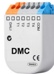
DMC – I/O-enhet DALI.