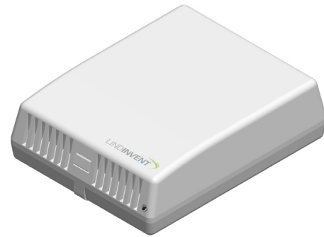
Den väggmonterade rumstemperaturgivaren GT-V. Givaren GTN-V har identisk kapsling.

GT-V och GTN-V är temperaturgivare för väggmontage i rumsmiljö. Givarna är placerade i en "luftig" kapsling, som ger en så kort tidskonstant som möjligt vid uppmätning av temperaturförändringar.