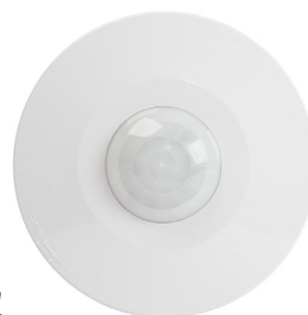
PDC-2400. Extern närvarogivare 24VDC/VAC för montage i innertak.