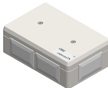
CBX - Kopplingsbox till aktivt tilluftsdon.

Det aktiva donet ansluts till CBX, som i sin tur ansluts till kommunikationsslingan. Lindinvent's standardkabel med ledare för spänningsmatning (24 VAC) och två partvinnade ledare för kommunikation används både i konstruktionen av kommunikationsslingan och när tillbehör ansluts till CBX och det aktiva donet.