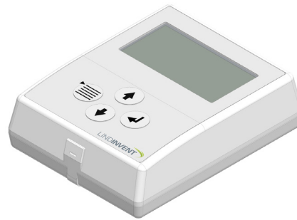
DRP - Digital rumspanel.