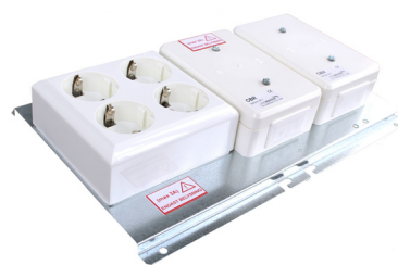
FMP-XRU. Färdigkopplad montageplåt med kopplingsbox CBX, reläbox för belysningsstyrning CBR och ett grenuttag.