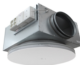
Montageplåt monterad på donlåda till aktivt tilluftsdon.