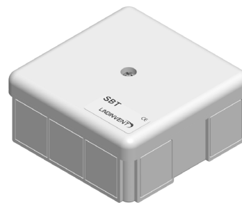
SBT - Styrenhet för termoställdon i enkeldosa.

Programmering av nod-id och koppling till radiatorzon mm sker via användarpanel DHP som tillfälligt ansluts till SBT.