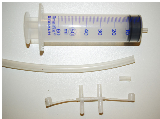
Luftspruta med tillbehör.

Kontrollera att slangarna från mätflänsen har återanslutits korrekt till rätt givaranslutningar på regulatören. Kontrollera igen att locken till nippelarna för kontrollmätning är på plats.