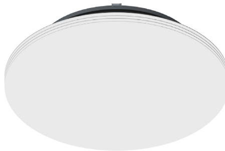
MTC - Reaktivt taktilluftsdon med fast underplåt.

Kontakta oss via www.lindinvent.se/service