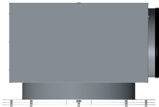
MTC - Don med fast underplåt. Här monterat i donlådan HMK, som används vid dolt montage.