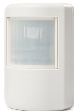
PD-2400. Ekstern nærværstetektor 24VDC/VAC til vægmontering.

PD-2400 er en 24 VDC/VAC spændingsforsynet passiv IR-detektor til nærværstetektion. Enheden er designet til vægmontering.